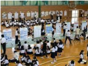
《気仙沼高校探究発表会へ参加》

進路実現に向けて、2年次で行った探究を論文集にまとめ、他校で行われる発表会に積極的に足を運び、ポスターセッションを行います。