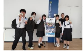
《石巻市政政策コンテスト》