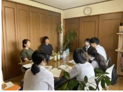
《フィールドワークの様子》

石巻地域のNPOや企業に協力をいただき、地域の課題を知り、その課題解決に高校生の視点で課題解決に取り組みます。