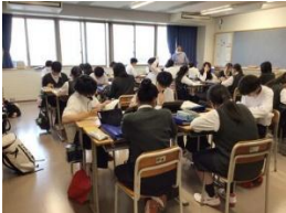
《研究テーマを作る》

大学の先生に協力をいただき、自分自身の興味関心のあるテーマを設定し、進路に結び付けた探究活動を行います。