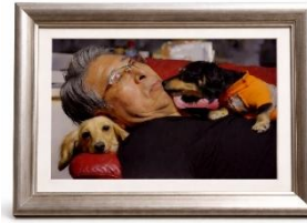
「定年後の暮らし」