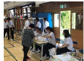
《貞山地区夏祭りボランティア》

教室での学びにとどまらず、地域や社会とつながる学校外活動を重視・推進しています。地域ボランティアや小学校での学習支援、市主催の政策コンテストへの参加、地域行事の運営協力、献血活動など、多様な校外活動に生徒が主体的に参加しています。