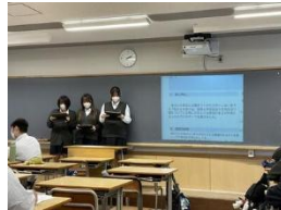
《大学教授への中間発表》