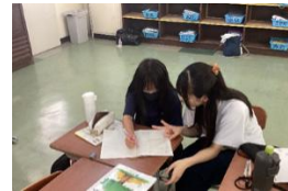
《釜小学校学習ボランティア》