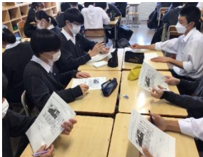
↑ グループディスカッション

3年次では、「自己実現研究」を行います。自分の進路を実現するために必要な発展的対話力、論理的思考力、論理的文章作成力を養うために「グループディスカッション」、「小論文・志望理由書」、「知的書評合戦ビブリオバトル」、といった活動を実施します。