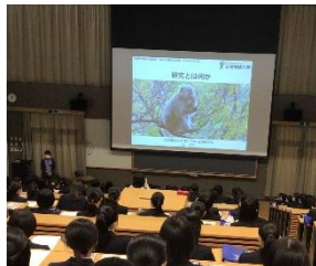
↑ 「研究を知る」講演会

2年次では、「分野別課題研究」を行います。この研究は「基礎講習」と「課題研究」の2つに分かれ、学問領域等に係る横断的・総合的な課題研究を行います。