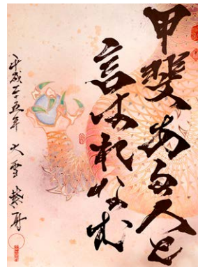
書家・紫舟氏による書画 「甲斐ある人と言はれなむ」