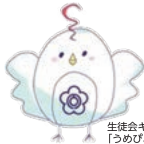
生徒会キャラクター 「うめびよ」